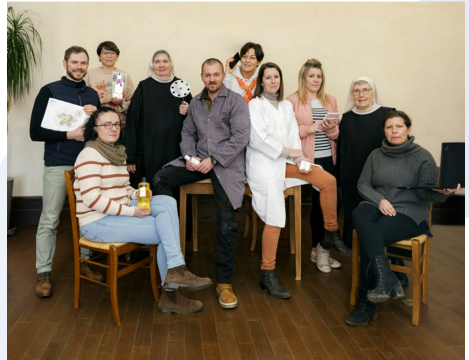
Les cogérantes avec l'équipe.